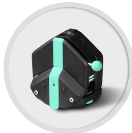
EasyPump-PPS 系列 (不可调压)