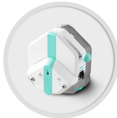
EasyPump 系列 (不可调压)